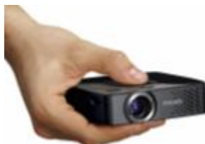
PicoPix PPX 3407