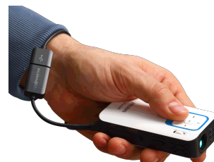
PicoPix PPX 2340

SAGEMCOM, EUROPAS MARKTFÜHRER BEI PICO-PROJEKTOREN 1 , ERWEITERT SEINE PRODUKTPALETTE UM EINE NEUE GENERATION VON PHILIPS PICOPIX TASCHENBEAMERN, MIT DENEN SICH SCHÖNE ERINNERUNGEN IN UNVERGLEICHLICHER BILDQUALITÄT MIT ANDEREN TEILEN LASSEN.