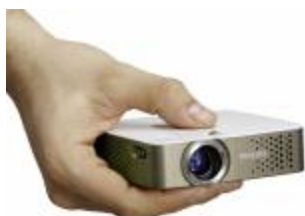
PicoPix PPX 3410